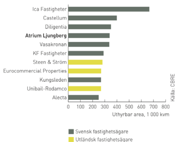
UTHYRBAR HANDELSAREA I SVERIGE 1)

Med stor inflyttning och befolkningstillväxt väntas Stockholm fortsätta att expandera och dominera svenskt näringsliv, vilket ger en attraktiv kontorshyresmarknad. I jakten på mer plats och större variation i hyresnivåerna har trycket på områden utanför den mest centrala stadskärnan ökat under de senaste åren, där närförort norr, närförort söder, Kista och det framväxande Hagastaden är exempel på eftersökta lägen. Atrium Ljungberg är per 31 december 2012 den nionde största ägaren av kontorsfastigheter i Stockholmsregionen 2) . I närförort norr är Fabège den största fastighetsägaren, med en marknadsandel på 35 procent av kontorsstocken i Solna. I Kista dominerar Klöver, med ett bestånd motsvarande drygt en fjärdedel av områdets kontorsyta. Andra stora fastighetsägare i närförort norr är Akademiska Hus, AREIM, Atrium Ljungberg, Humlegården och Vasakronan. Närförort söder domineras av Atrium Ljungberg och Fabège. Atrium Ljungbergs bestånd är per 31 december 2012 främst koncentrerat till Sickla, där totalt 130 000 kvm uthyrningsbar yta ägs, varav 78 000 kvm är kontor.